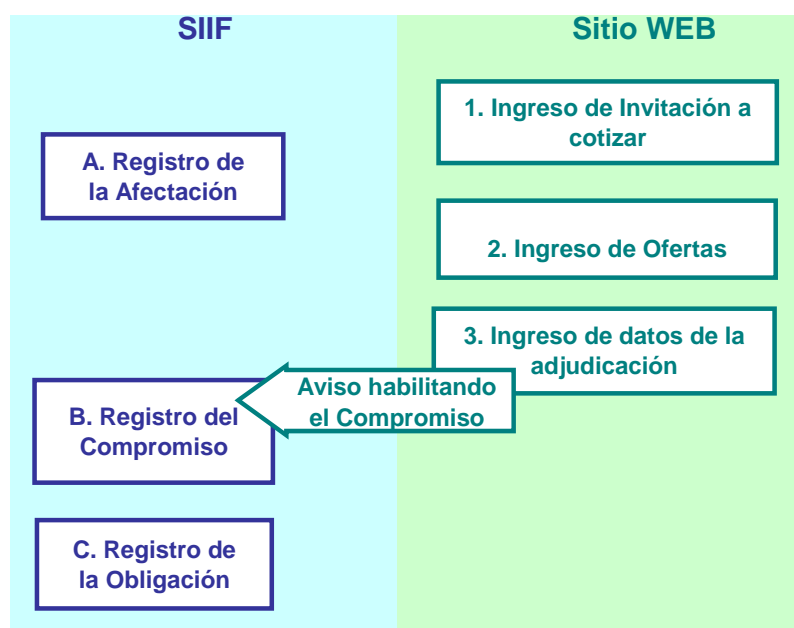
Figura 2 Flujo de datos entre el SIIF y el Sitio de Publicaciones para las Compras Directas